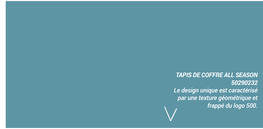
TAPIS DE COFFRE ALL SEASON 50290232 Le design unique est caractérisé par une texture géométrique et frappé du logo 500.