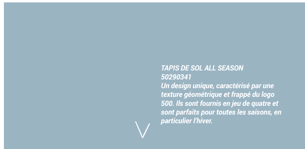
TAPIS DE SOL ALL SEASON 50290341 Un design unique, caractérisé par une texture géométrique et frappé du logo 500. Ils sont fournis en jeu de quatre et sont parfaits pour toutes les saisons, en particulier l'hiver.