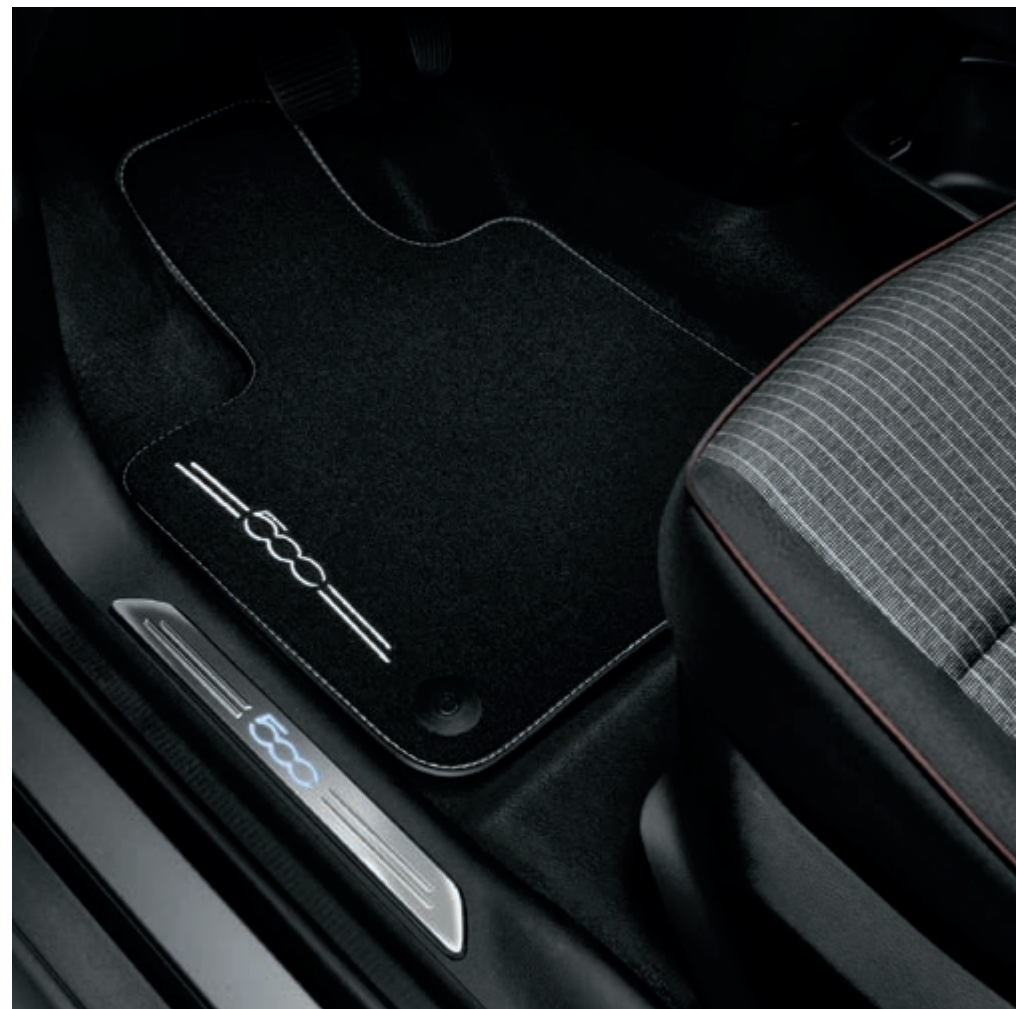
TAPIS DE SOL COMFORT 50290334 Une évolution du design, axée vers un futur plus durable. Ils sont fournis en jeu de quatre.