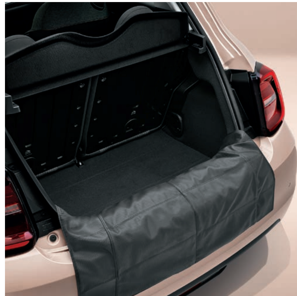
PROTECTION SEUIL DE COFFRE 50290493 La protection de seuil protège le coffre contre les rayures et les bosses pendant le chargement et le déchargement.