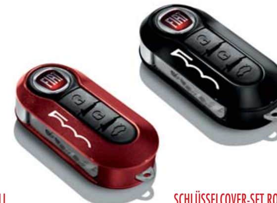
SCHLÜSSELCOVER-SET ROT METALIC UND SCHWARZ PASTELL KIT COQUES DE CLÉS ROUGE METALLIQUE ET NOIR PASTEL KIT COVER CHIAVI ROSSO METALLIZZAZO E NERO PASTELLO