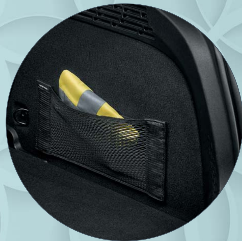
CARGO-NETZ MIT MOPAR® LOGO FILET À BAGAGES AVEC LOGO MOPAR® RETE VANO BAULE CON LOGO MOPAR®