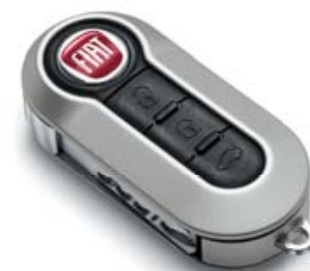
SCHLÜSSELCOVER SILBER MATT COQUE DE CLÉ ARGENT MAT COVER CHIAVE ARGENTO OPACO

Per distinguersi basta anche il più semplice degli accessori, come un cover chiavi o un badge. Perché nel caso della Nuova 500 i dettagli non fanno solo la differenza: la rendono perfetta!