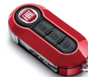
SCHLÜSSELCOVER GRÄNZEND-ROT COQUE DE CLÉ ROUGE BRILLANT COVER CHIAVE ROSSO BRILLANTE