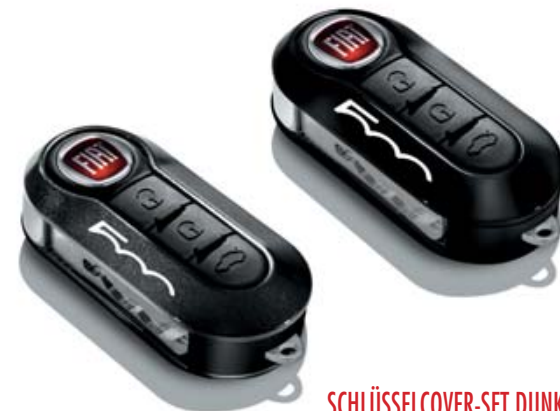
SCHLÜSSELCOVER-SET DUNKELGRAU UND SCHWARZ PASTELL KIT COQUES DE CLÉS GRIS FONCÉ ET NOIR PASTEL KIT COVER CHIAVI GRIGIO SCURO E NERO PASTELLO