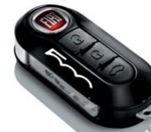
SCHLÜSSELCOVER SCHWARZ PASTEL COQUE DE CLÉ NOIR PASTEL COVER CHIAVE NERO PASTELLO