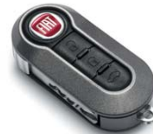
SCHLÜSSELCOVER DUNKELGRAU COQUE DE CLÉ GRIS FONCÉ COVER CHIAVE GRIGIO SCURO