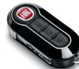
SCHLÜSSELCOVER IN PIANOSCHWARZ COQUE DE CLÉ NOIR LAQUÉ COVER CHIAVE NERO LUCIDO