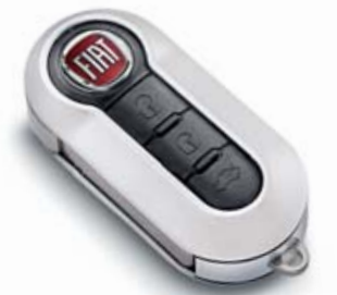
SCHLÜSSELCOVER PERLWEISS MATT COQUE DE CLÉ BLANC PERL MAT COVER CHIAVE BIANCO PERLA OPACO