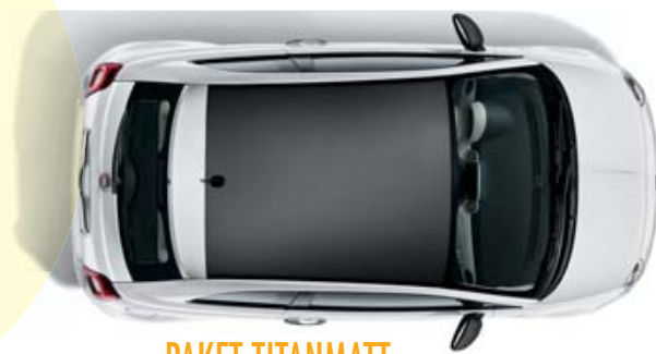
PAKET TITANMATT PACK TITANE MAT PACK TITANIO OPACO

Composto da: calotte specchi e tetto con rivestimento verde militare