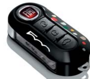
SCHLÜSSELCOVER SCHWARZ MIT PUNKTEN COQUE DE CLÉ NOIR À POIS COVER CHIAVE BIANCO NERA CON POIS