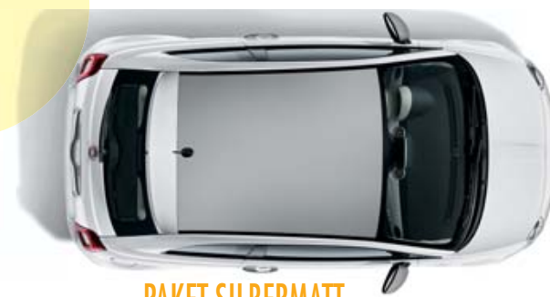
PAKET SILBERMATT PACK ARGENT MAT PACK ARGENTO OPACO

Rendi la tua Nuova 500 ancora più irresistibile e colorata con cinque nuovi Packs, ognuno contenente un diverso rivestimento per tetto e calotte specchi: ad esempio, micro carbon o jeans.