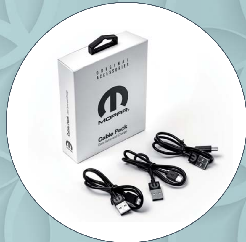
USB-KABEL APPLE CAR PLAY/ANDROID AUTO CÂBLE USB APPLE CAR PLAY/ANDROID AUTO CAVO USB APPLE CAR PLAY/ANDROID AUTO