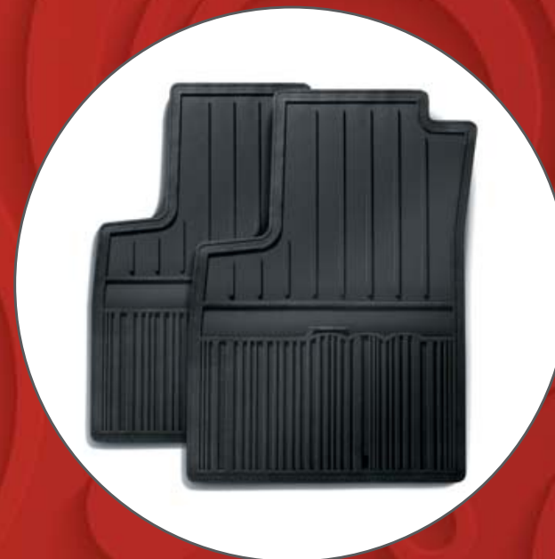
GUMMIFUSSMATTEN SURTAPIS CAOUTCHOUC TAPPETI IN GOMMA