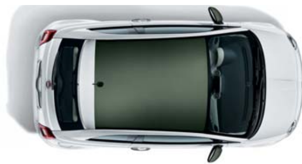
PAKET MILITÄRGRÜN PACK VERT MILITAIRE PACK VERDE MILITARE

Composto da: calotte specchi e tetto con rivestimento micro carbon nero