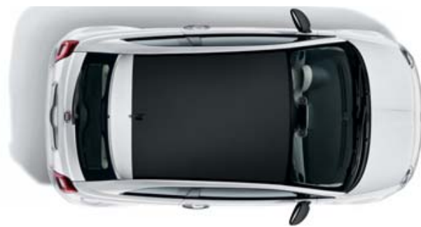
PAKET MIKRO-KARBON SCHWARZ PACK MICRO CARBONE NOIR PACK MICRO CARBON NERO