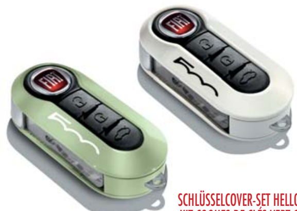
SCHLÜSSELCOVER-SET HELLGRÜN UND WEISS PASTELL KIT COQUES DE CLÉS VERT CLAIR ET BLANC PASTEL KIT COVER CHIAVI VERDE CHIARO E BIANCO PASTELLO