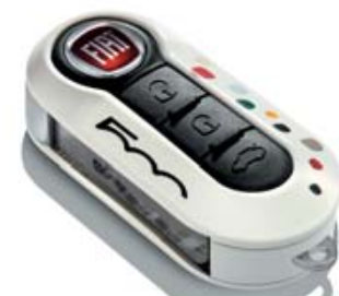
SCHLÜSSELCOVER WEISS MIT PUNKTEN COQUE DE CLÉ BLANC À POIS COVER CHIAVE BIANCA CON POIS