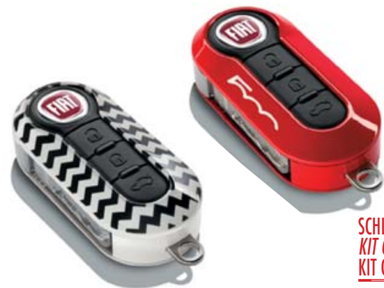
SCHLÜSSELCOVER-SET „CHEVRON“ KIT COQUES DE CLÉS „CHEVRON“ KIT COVER CHIAVI „CHEVRON“

2-er Set: weiss/militärgrün und weiss/blau. Kit de 2 : coloris blanc/vert militaire et blanc/bleu. Set di 2: bianco/verde militare e bianco/blu. 50927693