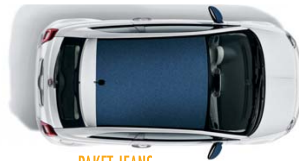
PAKET JEANS PACK JEANS PACK JEANS

Composto da: calotte specchi e tetto con rivestimento argento opaco