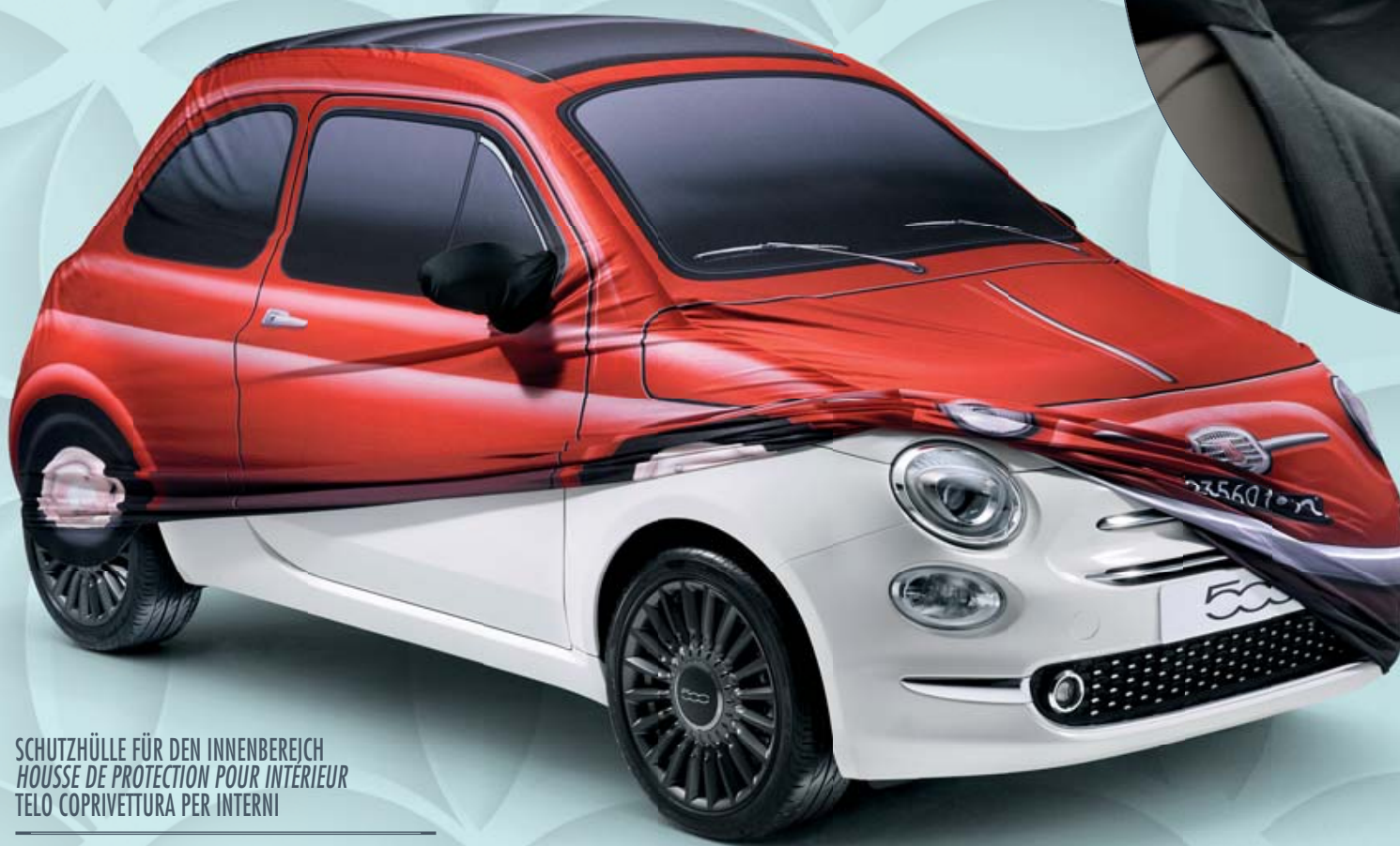
SCHUTZHÜLLE FÜR DEN INNENBEREICH HOUSSE DE PROTECTION POUR INTERIEUR TELO COPRIVETTURA PER INTERNI

È naturale innamorarsi di un'icona come la Nuova 500: per questo Mopar® ti offre i prodotti giusti per prendertene cura e mantenere intatto il suo fascino negli anni a venire.