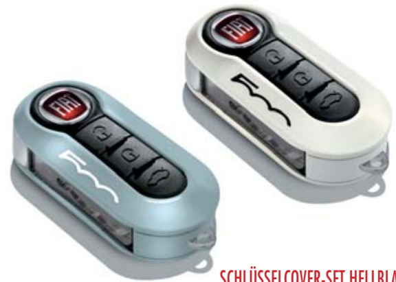
SCHLÜSSELCOVER-SET HELLBLAU UND WEISS PASTELL KIT COQUES DE CLÉS BLEU CLAIR ET BLANC PASTEL KIT COVER CHIAVI AZZURRO E BIANCO PASTELLO