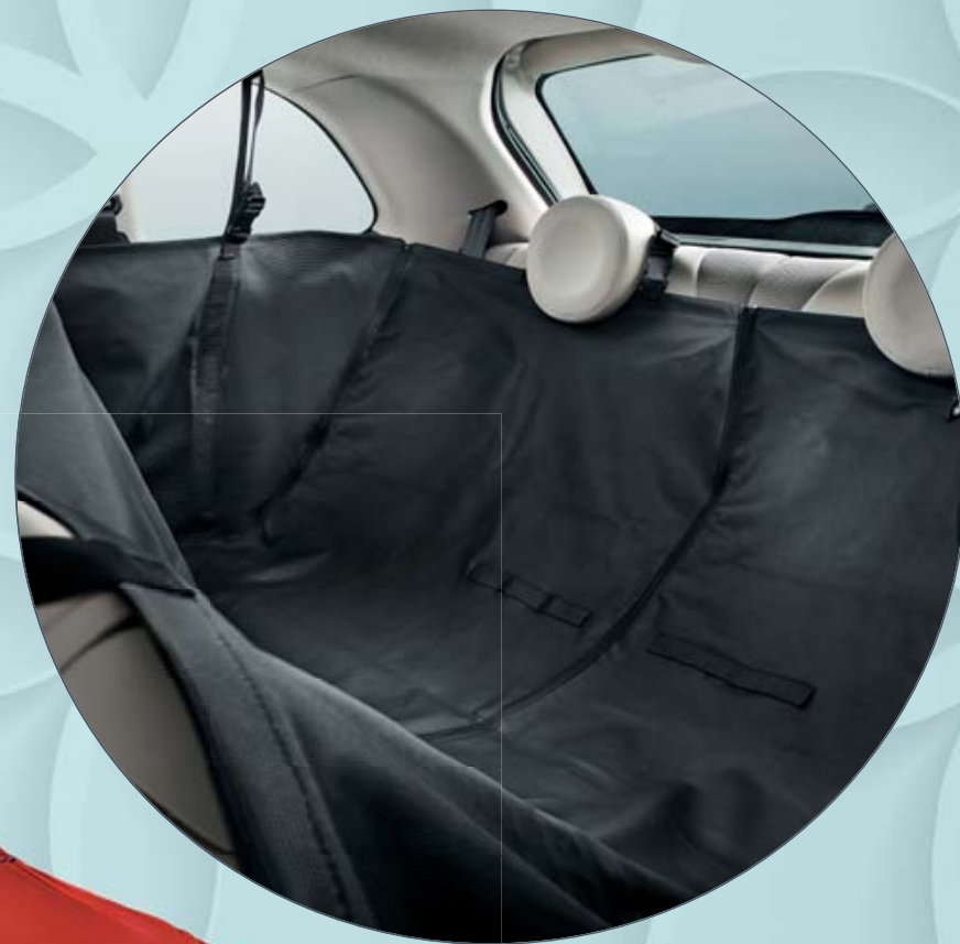
ABDECKUNG FÜR RÜCKSITZE PROTECTION POUR SIEGES ARRIÈRE COPRISIEDILI POSTERIORI

Damit können Sie die Rücksitze ganz oder zur Hälfte abdecken.