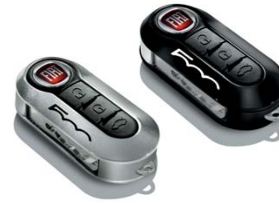
SCHLÜSSELCOVER-SET HELLGRAU UND SCHWARZ KIT COQUES DE CLÉS GRIS CLAIR ET NOIR KIT COVER CHIAVI GRIGIO CHIARO E NERO