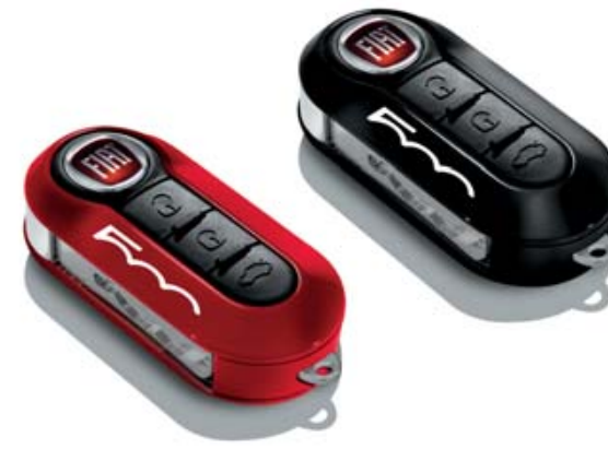
SCHLÜSSELCOVER-SET ROT UND SCHWARZ PASTELL KIT COQUES DE CLÉS ROUGE ET NOIR PASTEL KIT COVER CHIAVI ROSSO E NERO PASTELLO