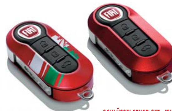
SCHLÜSSELCOVER-SET „ITALIA“ KIT COQUES DE CLÉS « ITALIA » KIT COVER CHIAVI „ITALIA“

2-er Set: Schachbrettmuster und 500-Logo. Kit de 2 : Damier et logo 500. Set di 2: a scacchi e logo 500. 71805963