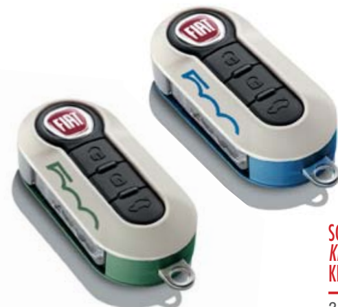
SCHLÜSSELCOVER-SET BICOLOR MIT 500-LOGO KIT COQUES DE CLÉS BICOLORES AVEC LOGO 500 KIT COVER CHIAVI BICOLORE CON LOGO 500

2-er Set: Farbdesign der italienischen Flagge und metallisiertem rot. Kit de 2 : coloris rouge métallisé avec drapeau italien. Set di 2: grafica bandiera italiana e colore rosso metallizzato. 71805964