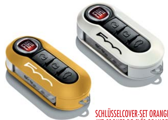
SCHLÜSSELCOVER-SET ORANGE UND WEISS PASTELL KIT COQUES DE CLÉS ORANGE ET BLANC PASTEL KIT COVER CHIAVI ARANCIONE E BIANCO PASTELLO