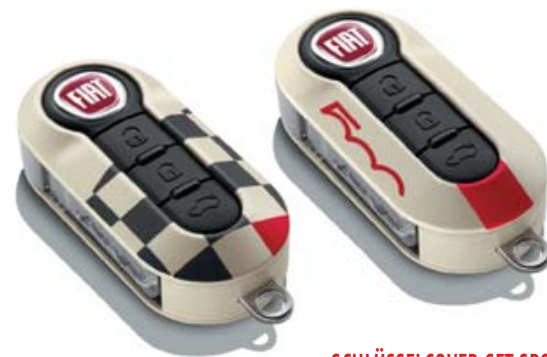
SCHLÜSSELCOVER-SET SPORT KIT COQUES DE CLÉS SPORT KIT COVER CHIAVI SPORT

2-er Set: Schachbrettmuster und 500-Logo. Kit de 2 : Damier et logo 500. Set di 2: a scacchi e logo 500. 71805963