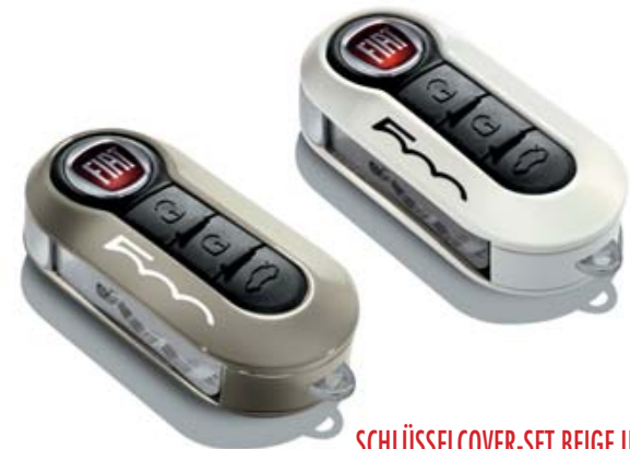
SCHLÜSSELCOVER-SET BEIGE UNF WEISS PASTELL KIT COQUES DE CLÉS BEIGE ET BLANC PASTEL KIT COVER CHIAVI BEIGE E BIANCO PASTELLO